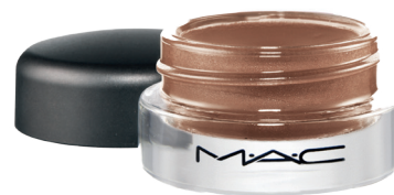
MAC Pro Longwear Paint Pot Groundwork 175,-

Psst .... brug den med MAC pensel 217 - en musthave pensel